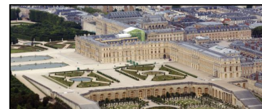
Louis XIV dansant - Le château de Versailles 1638-1715